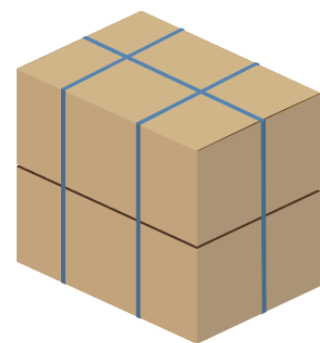
1 BUNDLE ( 2 CARTONS )